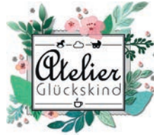
Meike Baumgarten, Leitung KoStelle Merle Dehn, Atelier Glückskind

In einer halbstündigen Sprechstunde haben Sie die Möglichkeit, die Funktion der Koordinierungsstelle Frauen und Wirtschaft kennenzulernen. Sozialpädagogin und systemische Familienberaterin Meike Baumgarten steht für Fragen rund um die berufliche Neuorientierung während und nach der Elternzeit unterstützend zur Seite.