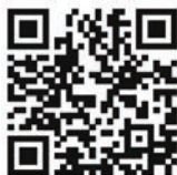
QR-Code Xpert Business

Xpert Business LernNetz ist ein bundesweit anerkanntes System für kaufmännische und betriebswirtschaftliche Weiterbildung. Die Kurse vermitteln im Live-Webinar Kompetenzen zu Finanzen, Lohn und Gehalt, vom Einstieg bis zu Profiniveau. Das Kurs und Zertifikatssystem besteht aus mehreren Modulen, die je nach Interesse und schon vorhandenen Kenntnissen individuell ausgewählt und kombiniert werden können. Nach jedem Kurs besteht die Möglichkeit, eine standardisierte Prüfung abzulegen. Bei bestandener Prüfung erhalten Sie ein bundesweit anerkanntes Zertifikat. Eine Übersicht der LernNetz Bausteine finden Sie hier: