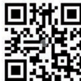
QR-Code VHS Jahresprogramm

Halten Sie die Kamera Ihres Smartphones oder Tablets über diesen QR-Code! Der leitet Sie dann direkt zu der passenden vhs-Website mit ausführlichen Informationen. Das gesamte Jahresprogramm finden Sie unter www.vhs-celle.de